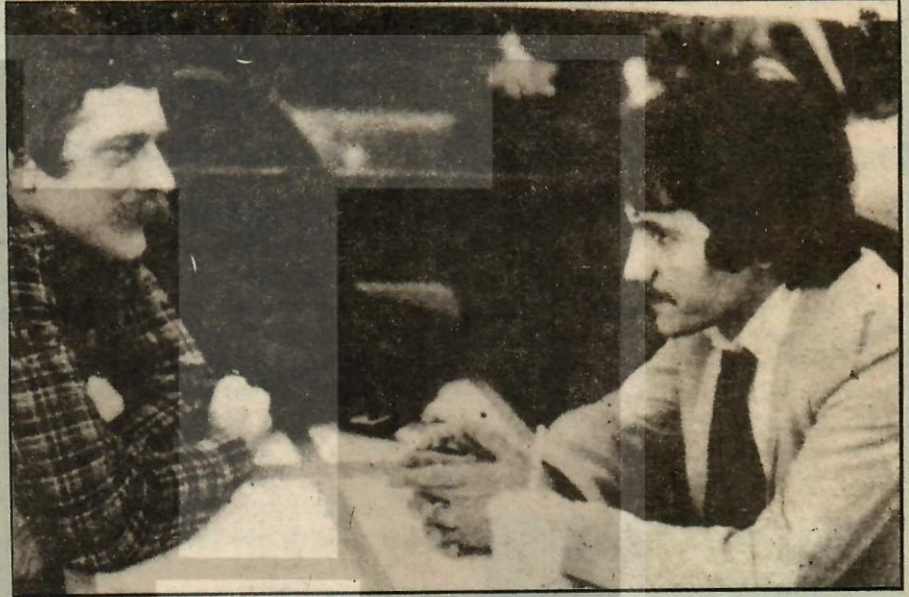
Tanlak (Siyah gravatlı): İtiraflarına yurt dışında da devam etti. Ve Türkiye'ye dönerek teslim oldu.

İddianameye göre, sanığın ihbarı ile başlayan bu operasyon sanıkların yönetiminde bulunan Selahiye Kültür erneği'nde silahlar ele geçirilmiş. Sa- nık ise bu silahların oraya ölkücülere uzak kurmak amacıyla yerleştirildiğin- i ısrar ediyor.