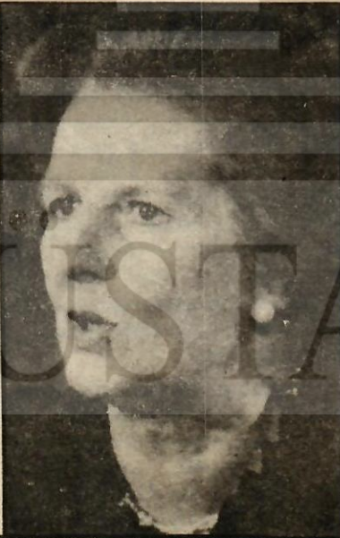
İki astsolist: Frank Sinatra ve Margaret Thatcher.

Maliyet: 350.000 ABD Doları; yaklaşık 50 Milyon TL. Bu maliyetin büyük çoğunluğu Amerikan 'Korporasyon'larınca 'bağış' olarak ödenmiş