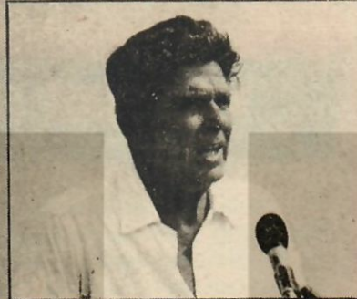
ABD Reagen döneminde yoksulluğu yeniden keşfediver.

A BD'nin ciddi ve tanınmış yayın organlarından International Herald Tribune 22 Ocak 1982 günlü sayısında, "Birleşik Devletlerde yoksulluğun yeniden keşfi" başlığı altında, bu ülkede biryandan zenginler daha da zenginleşirken, bir yandan da yoksulların daha da yoksullaştığı ve yoksulluğun yeniden keşfedildiği bildiriliyor. Habere göre, Birleşik Devletler Sayım Bürosu, İkinci Dünya Savaşı sonrası döneminin en geniş gerçek gelir gerilemesini ve 1960'lı yılların başlarında istatistik derlemeğe başladığından bu yana en hızlı yoksulluk artışını keşfetmiş bulunuyor.