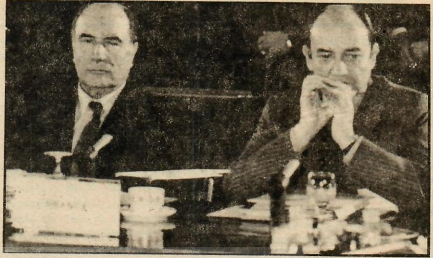
Mitterrand—Cheysson: Ara seçimler bir ihtar mı?

Oysa Anayasa mahkemesinin son kararı evdeki hesabın çarşuya uymadığını gösterdi. Halkoyunun ağırli-