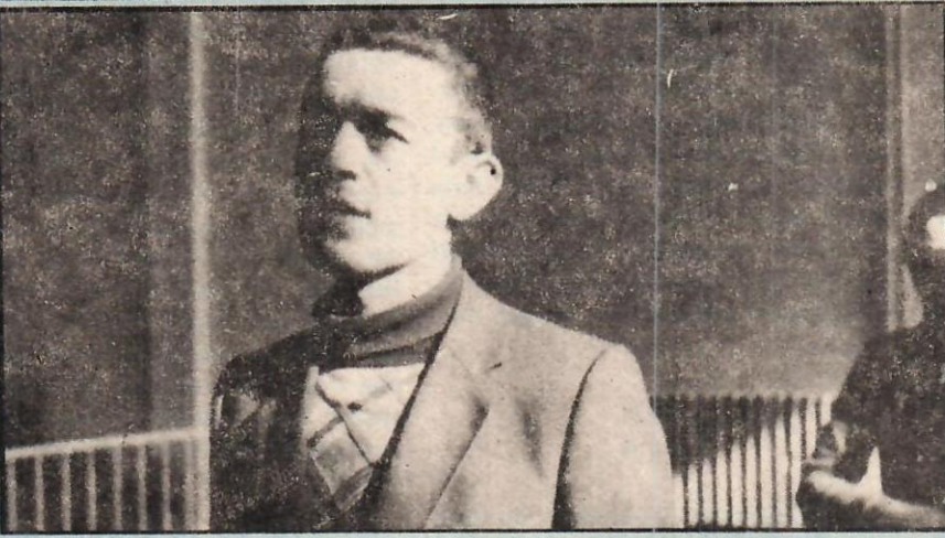
Koçyiğit: MHP Davasının seyrini değiştirmeye çalışmak iddiasıyla yargılanıyor.